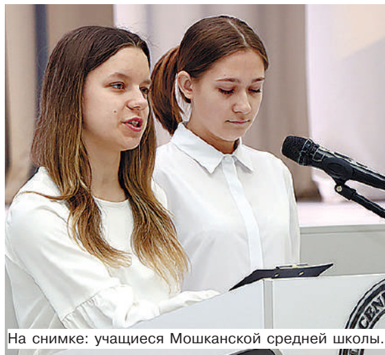
На снимке: учащиеся Мошканской средней школы.