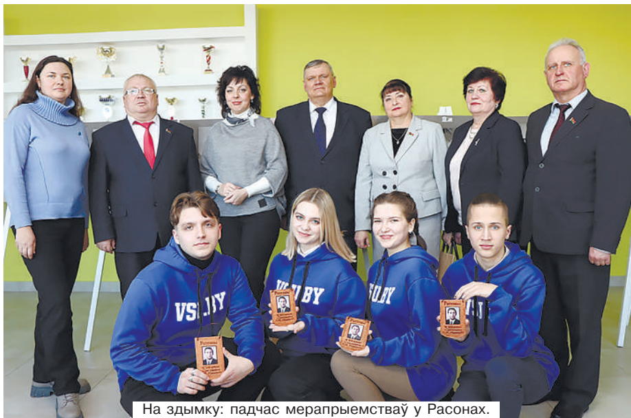
На здымку: удзельнікі інтэлектуальнай гульні.