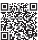
Фото- и видеорепортаж с церемонии смотрите с помощью QR-кода.