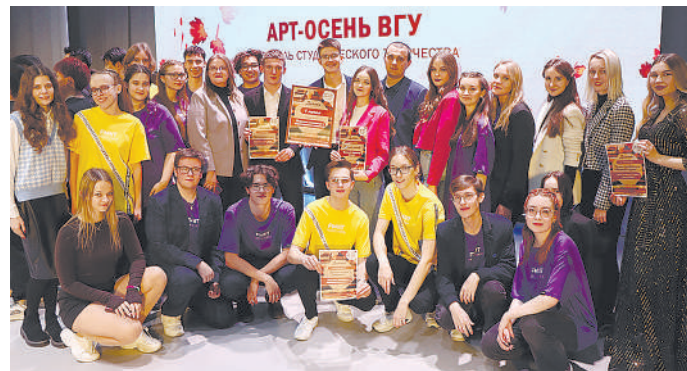
Фото- и видеопортаж с концерта смотрите с помощью QR-кода.

Виктория АЛЕКСАНДРОВА.