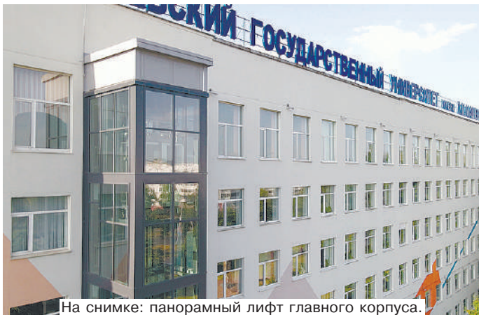
На снимке: панорамный лифт главного корпуса.

– В прошлом году рабочая группа по развитию материально-технической базы университета в вашем лице