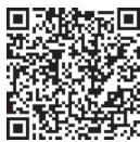
Фото- и видеоре- портаж со встречи выпускников смот- рите с помощью QR-кода.