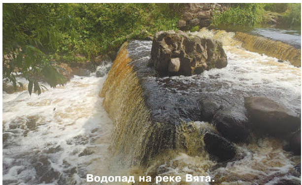
Водопад на реке Вятя.