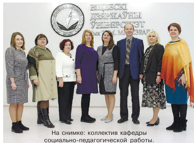
На снимке: коллектив кафедры социально-педагогической работы.

Алеся ДУБРОВСКАЯ.