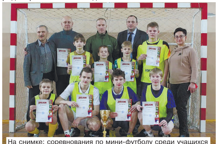
На снимке: соревнования по мини-футболу среди учащихся с особенностями психофизиологического развития.