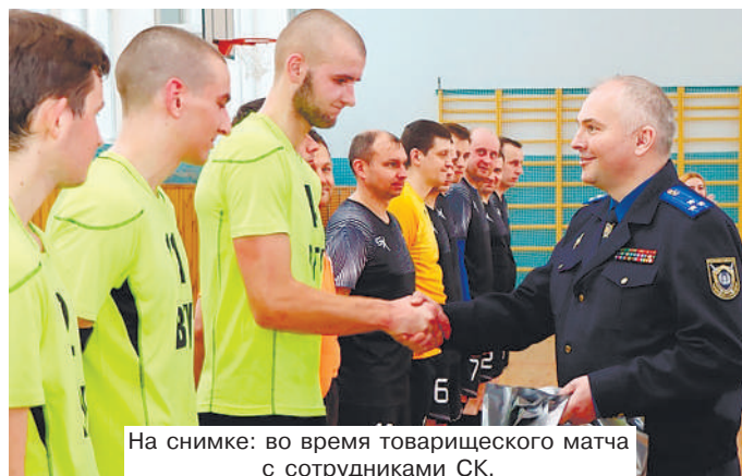
На снимке: во время товарищеского матча с сотрудниками СК.