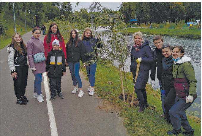
На снимке: волонтеры ФХБиГН во время посадки деревьев.