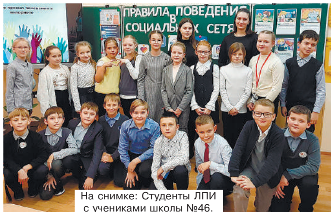
На снимке: Студенты ЛПИ с учениками школы №46.