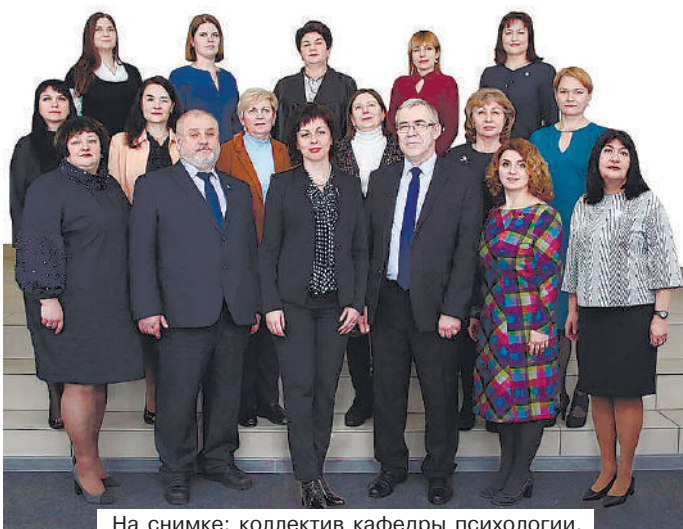
На снимке: коллектив кафедры психологии.

Обучение на ФСПиП носит практико-ориентированный характер. Способствуют это-