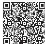
Фото- и видеорепортаж с торжественного заседания совета университета смотрите с помощью Qr-кода.