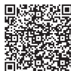
Фото- и видеорепортаж с мероприятия смотрите с помощью QR-кода.