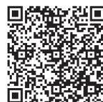
Фото- и видеорепортаж с торжественного концерта смотрите с помощью QR-кода.