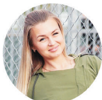
Марина ШКЕРМАНКОВА, белорусская тяжелая атлетка, бронзовый призер Олимпийских игр:

Всему коллективу – мира, добра и благополучия! Пусть девиз Docendo discimus останется тем вечным двигателем, который вот уже более века помогает Вместе Генерировать Успех!