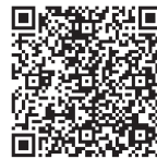
Фото- и видеорепортаж со спортивного праздника смотрите с помощью QR-кода.

Алеся МЯДИЛЬ.