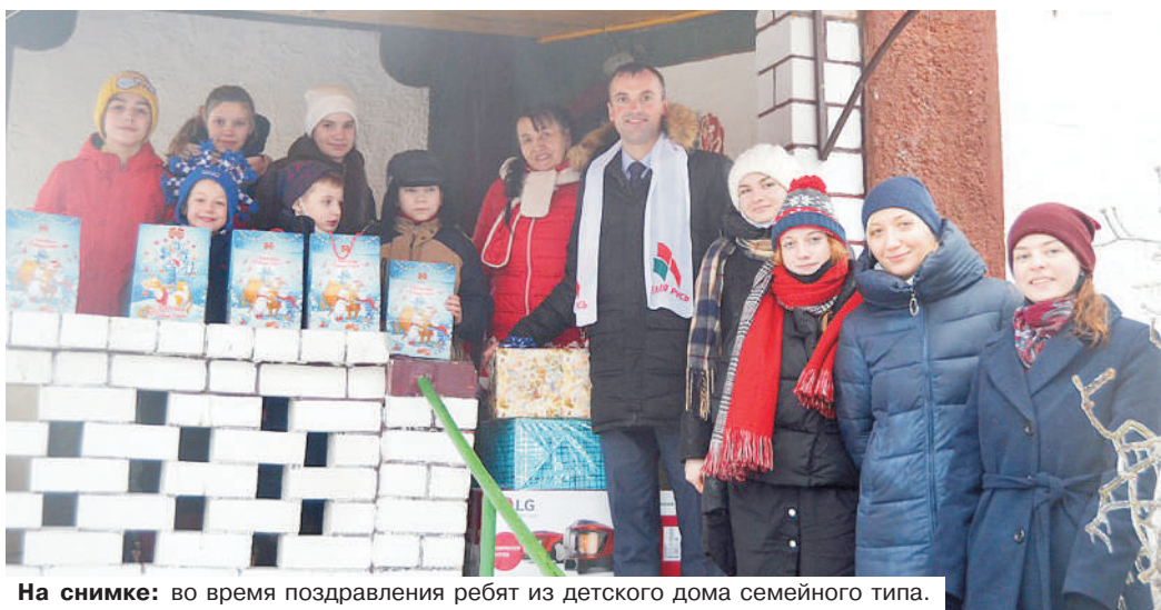
На снимке: во время поздравления ребят из детского дома семейного типа.

Студенты волонтерского ВГУ всегда готовы поддержать любые инициативы.