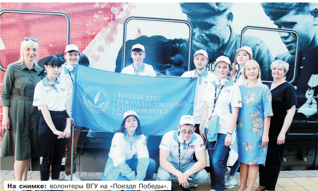
На снимке: волонтеры ВГУ на «Поезде Победы».

На добрые дела время можно найти всегда. По крайней мере, у студентов нашего университета отлично получается совмещать учебу, занятия наукой и спортом с активной общественной работой. Волонтеров ВГУ можно встретить на различных городских мероприятиях, акциях, праздниках.