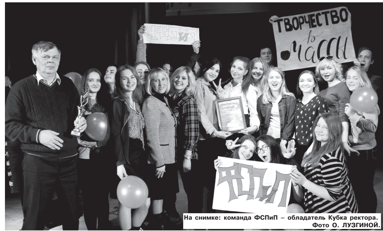
На снимке: команда ФСПиП – обладатель Кубка ректора.

нологий. Несмотря на то, что первыми выступать очень сложно, они справились с волнением и задали высо-