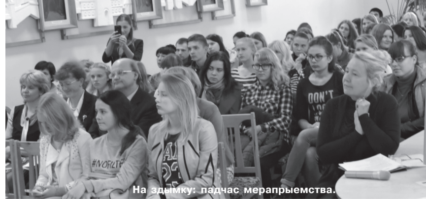
На здымку: падчас мерапрыемства.

паэзія Ніла Гілевіча. Яны чыталі вершы, прысвечаныя роднаму краю, маці, каханню, спявалі песні на словы лірыка. Сярод запрошаных гасцей на вечарыне прысутнічалі былыя студэнты Ніла Сымонавіча – дацэнт