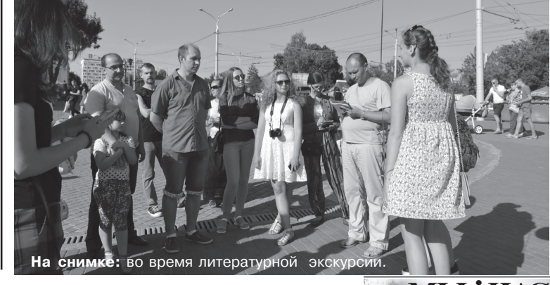
На снимке: во время литературной экскурсии.