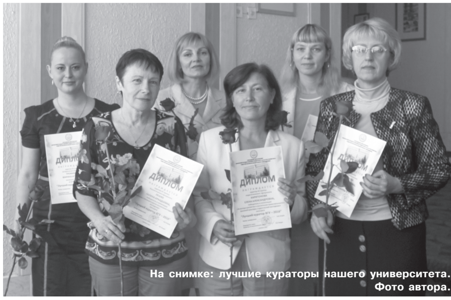
На снимке: лучшие кураторы нашего университета.

тому как многие проекты (да и выступления студенческих групп в целом) заслуживали того, чтобы их назвали лучшими. После продолжительных дискуссий жюри объявило результаты: дипломом за третье место наградили студентов 21-й группы БФ, второе место заняли студенты 21-й группы ФлФ, а заслуженную победу праздновали юристы 31-й группы.