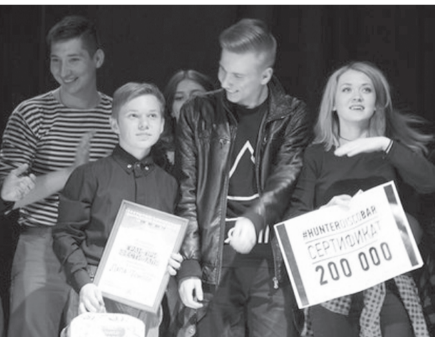
На снимке: во время игры.

Што прываблівае аматараў чарадзейных казак, сучаснага фэнтэзі і класічнай фантастыкі?.. Незвычайныя персанажы, таямнічыя гісторыі, загадкавы сюжэт, жаданне адпачыць ад праблем рэальнага жыцця і акунцэ ў дзівосны свет твора. Апошняе маглі зрабіць студэнты і госці на сустрэчы з маладой віцебскай пісьменніцай Ганнай Навасельцавай.